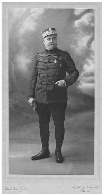
vers 1915